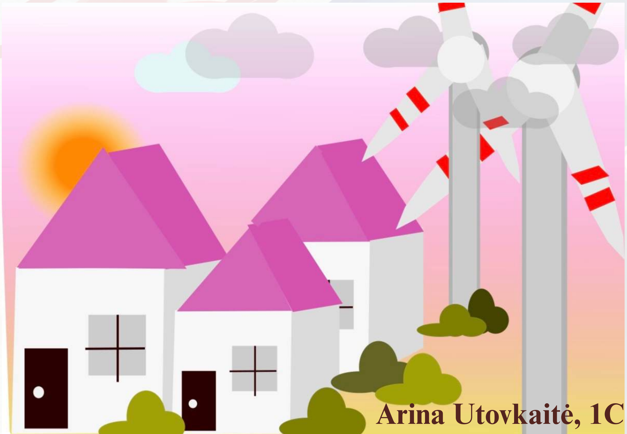
Arina Utovkaitė, 1C